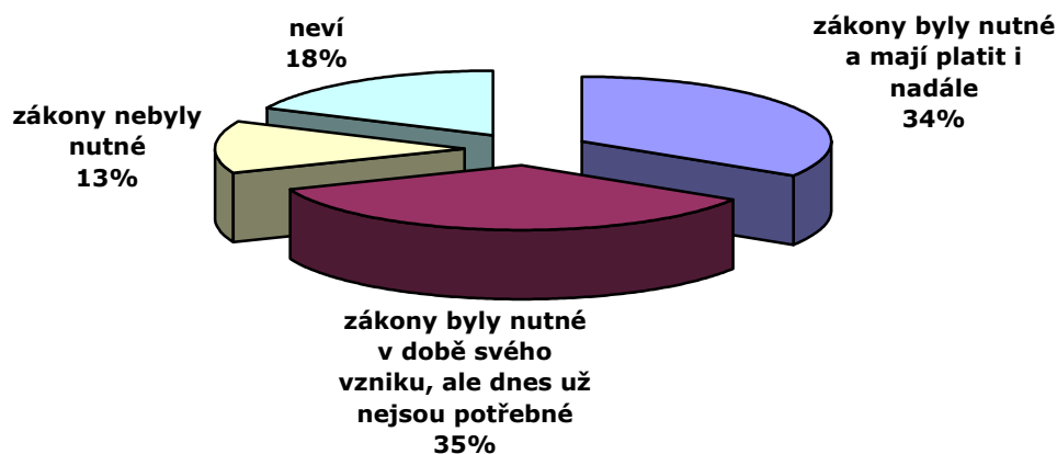
Graf 2: Názory na nutnost lustračních zákonů (%)

Z šetření vyplynulo, že asi třetina (34 %) lidí se domnívá, že lustrační zákony byly nutné a že by měly platit i nadále. Prakticky stejný podíl (35 %) Čechů pak zastává názor, že lustrační zákony sice byly nutné v době svého vzniku, ale že v současné době nejsou potřebné. Pouze 13 % lidí si myslí, že