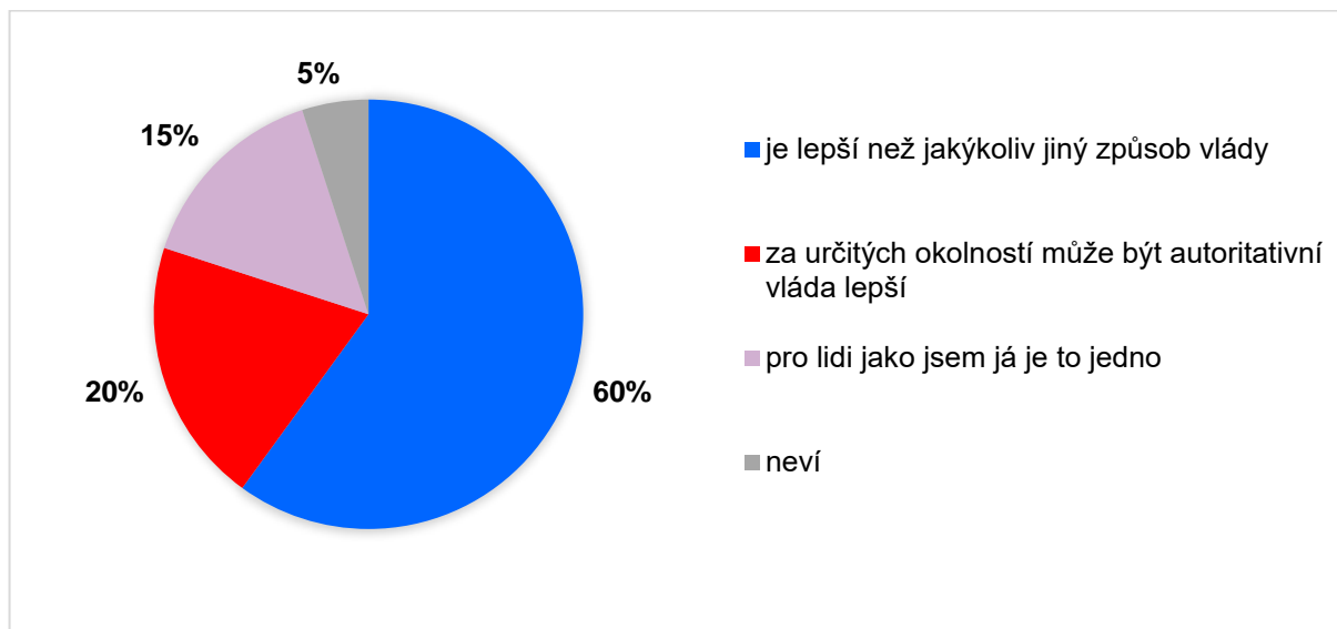
Graf 3: Výroky o demokracii